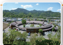
「道の駅しもにた」外観