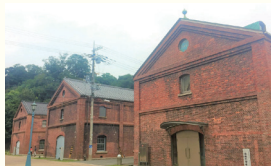
舞鶴市の赤レンガ博物館

舞鶴市では、0歳から15歳までの切れ目のない教育の充実を掲げており、乳幼児に対し、質の高い充実した教育を実施しています。